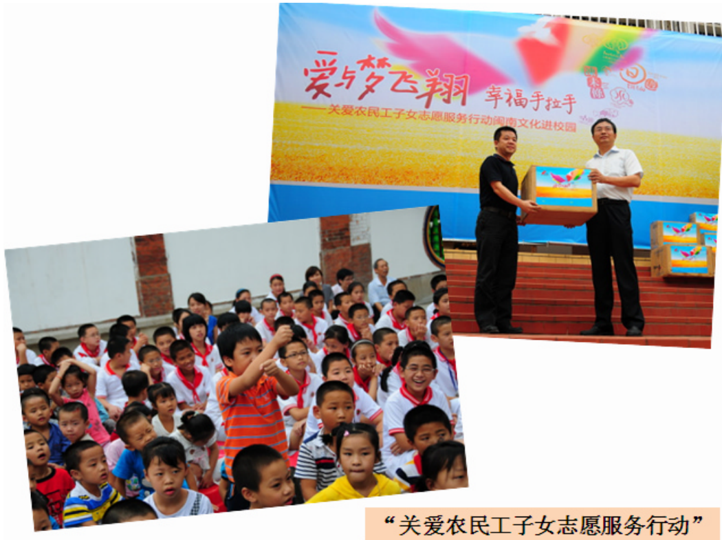
“关爱农民工子女志愿服务行动”

作为省级文明单位，公司常年支助厦门教育、卫生、体育、文化事业，多年坚持开展贫困村扶贫慰问活动，年内，公司再次荣获由福建省红十字会颁发的“人道金质奖章”。